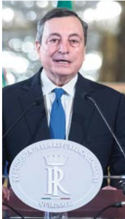
il premier Mario Draghi

“La sicurezza è un presupposto necessario per preservare e rafforzare le nostre democrazie e i nostri sistemi economici e sociali” ha precisato Draghi. Parole che chiunque sottoscriverebbe. Eppure, quando si tratta di passare ai fatti le cose si complicano col bel risultato che, come Paese, finiamo puntualmente per farci del male da soli. Signor presidente, ci faccia un favore: i suoi autorevoli proponenti li ripeta con un tono di voce di un'ottava più alto al ministro degli Esteri, Luigi Di Maio, visto che lui la storia di confermare l'impegno del Governo sulle spese della Difesa non l'ha capita granché.