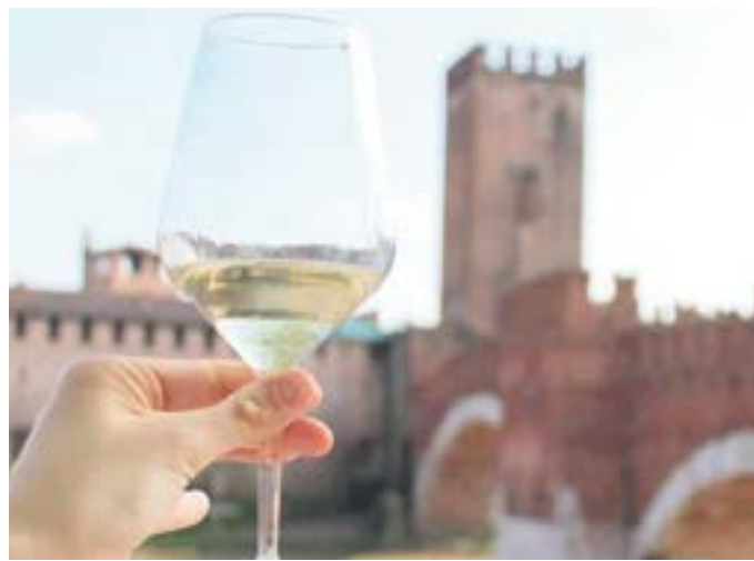
L'evento si terrà presso le Gallerie Mercatali

Dopo lo stop causato dal Covid, Vinitaly è l'occasione di mercato che per quanto riguarda il vino equivale a una grande preziosa occasione. Il faccia a faccia tra acquirenti e venditori. Un momento importante sotto l'aspetto delle contrattazioni, col il problema non insignificante del non potersi stringere la