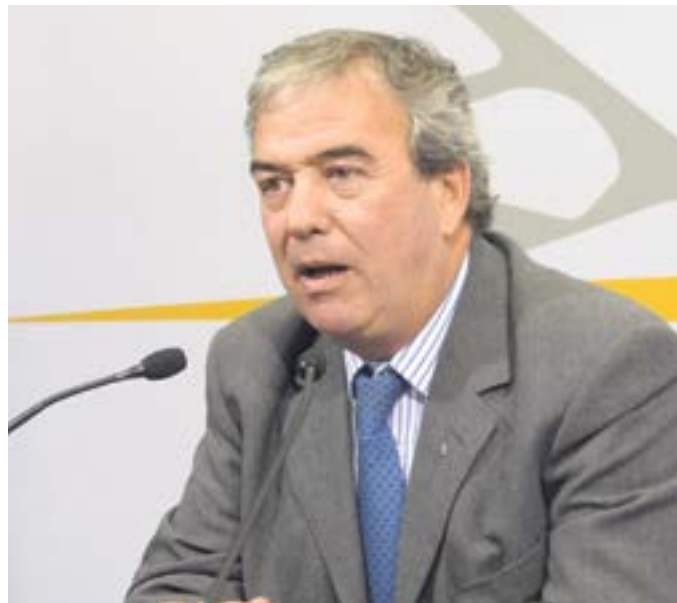
El ministro del Interior, Luis Alberto Heber

El jerarca se refirió nuevamente a la necesidad de modificar la normativa, de manera de permitir la realización de allanamientos nocturnos. "La Policía está